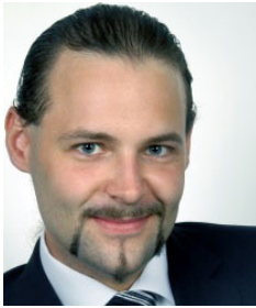
□ Stefan Mieth