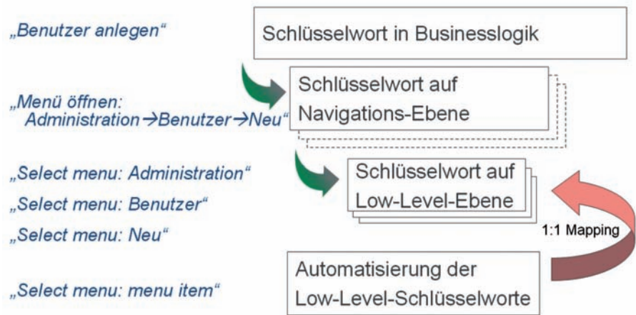
Abb. 3: Hierarchische Abbildung der Schlüsselworte mittels dreier Ebenen.

Die letztendliche Abbildung des Tests auf eine Reihe von Controls der Low-Level-Ebene erzeugt einen hohen Grad an Wiederverwendung auf der Low-Level-Ebene, aber auch auf der Navigations-