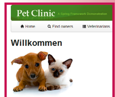
Abb. 1: Spring Pet Clinic

Als letzten Schritt der Vorbereitung importieren wir die Anwendung in eine IDE unserer Wahl, zum Beispiel Eclipse (Kepler, SP2), IntelliJ IDEA (13+) oder Netbeans (8+). Ältere Versionen sind keine guten Voraussetzungen, um auf Java 8 zu wechseln.