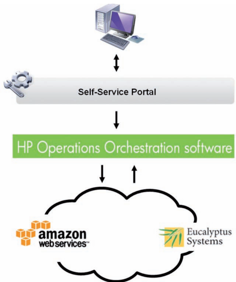
Abbildung 3: Umsetzung Automatisierung

Der HP LoadRunner dient zum Erstellen einer exakten Analyse der End-to-End Systemperformance. Dabei wird, zum Beispiel im Rahmen von Integrationstests, überprüft, ob neue oder aktualisierte Applikationen Ihre Performanceanfor-